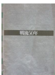
【南日本新聞社「8・6鹿児島風水害」(左)と 毎日新聞社「戦後50年」(右)】