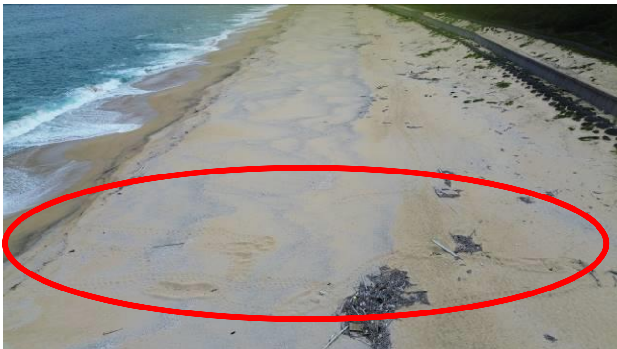
【5月にドローンで撮影したウミガメの足跡】

ご存知のとおり岸良学園では、ウミガメの学習を行っています。この一貫として、学校のドローンを使って岸良浜の様子を写真や動画に記録してきました。最近のドローンは驚くほど画質がよく、浜にあるウミガメの足跡や散乱しているゴミなどをしっかりと捉えることができます。これまで浜を歩いて確認していた作業もあっという間に終わることができ、しかも記録までできるとは隔世の感があります。今後、こうした最先端技術を使って、より幅の広い、より深い学習を行っていける可能性があります。